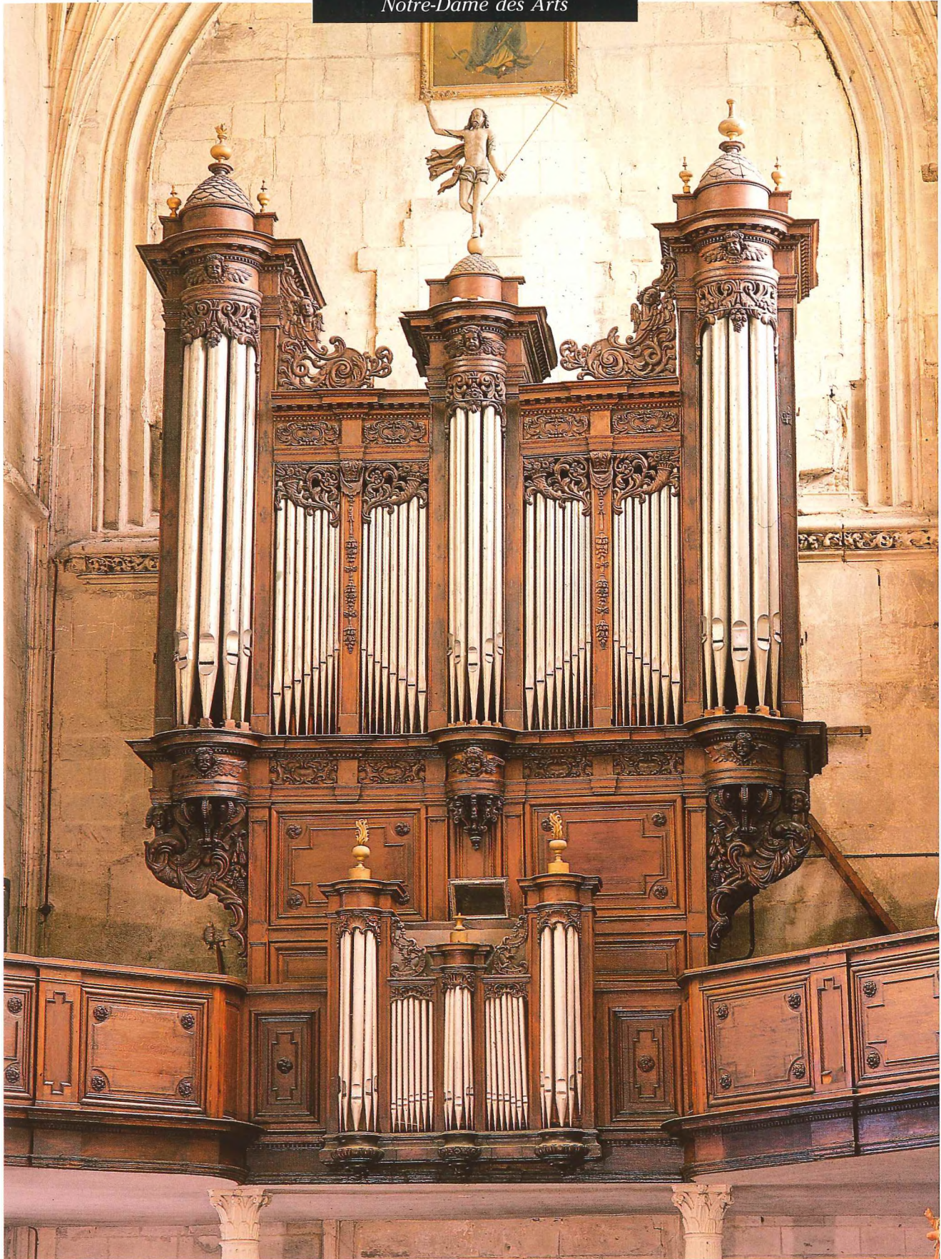
PONT DE L'ARCHE Orgue de l'église Notre-Dame des Arts