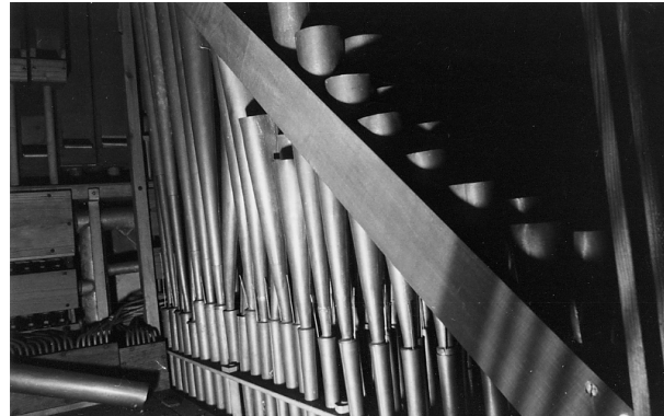
Tuyauterie du R.

2e clavier - Récit expressif – C1 à G5 – 56 notes. En suivant ceux du grand orgue, séparés par un passage d'accord