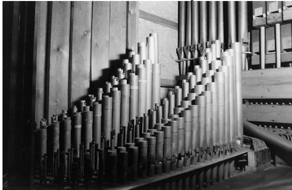
Tuyauterie du GO