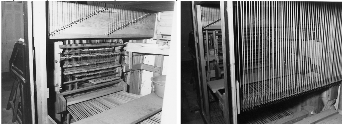
deux vues de la mécanique dans le soubassement

m) Traction des claviers : Mécanique au G.O. jusqu'à l'arrivée au tampon de laye. Relais pneumatiques. Même schéma pour le Récit et la pédale