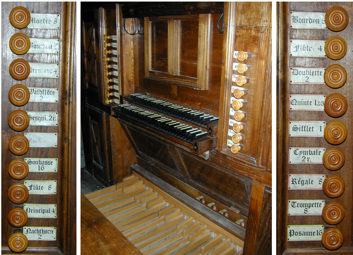
Pédales de combinaison Tirasse GO Tirasse Pos Accouplement Trémolo