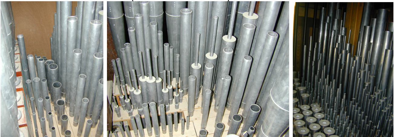
deux vues de la tuyauterie du GO