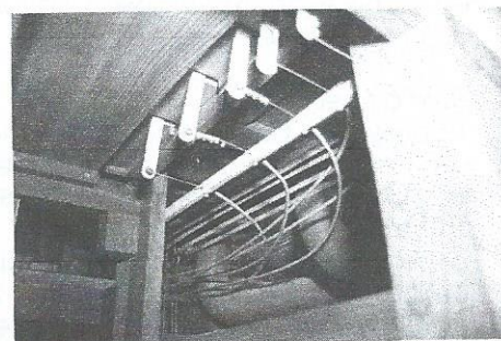
Système de tirage de jeux

Traction des notes : mécanique. Traction des jeux : mécanique par câbles métalliques sous gaine plastique.