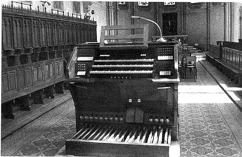
Ancienne disposition de la chapelle : console de l'orgue de Rochesson (démonté en 1990).