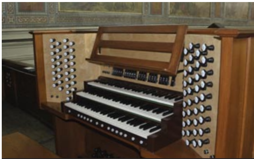
Console.