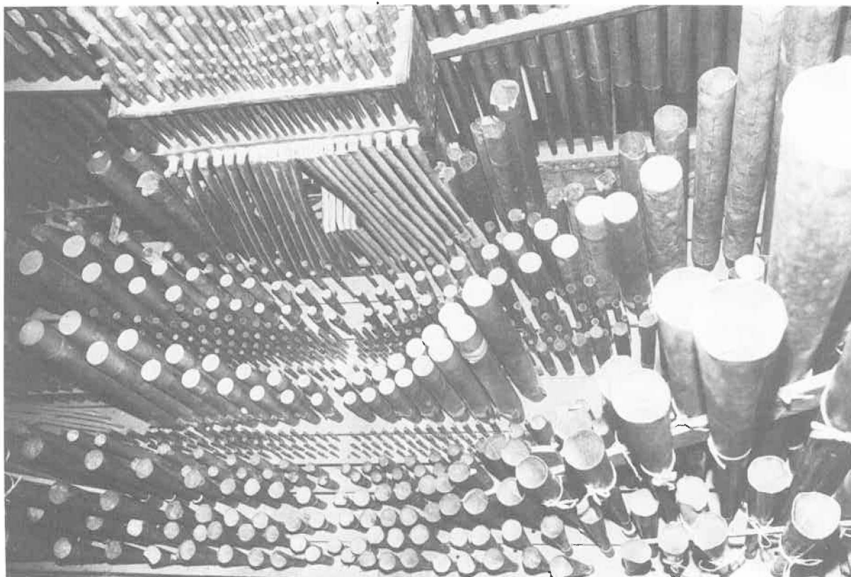
Tuyauterie du G.O.