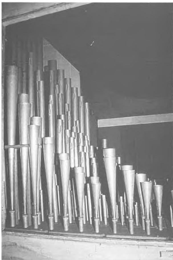
Détails de tuyauterie

– Trompette 8, étain; C-H pointes démontables; reprise harmonique au f''; noyaux anglais, pieds à bagues, anches à bec, rasettes à ressorts en acier. Sur d#: étiquette papier «n° 145 trompette 8 42 notes provenant des Blancs Manteaux».