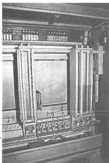
Intérieur de la console

Ruche, 1950; séparée, sur le côté gauche de la tribune en regardant l'orgue; en chêne, intérieur plaqué acajou sapelli, à rideau.