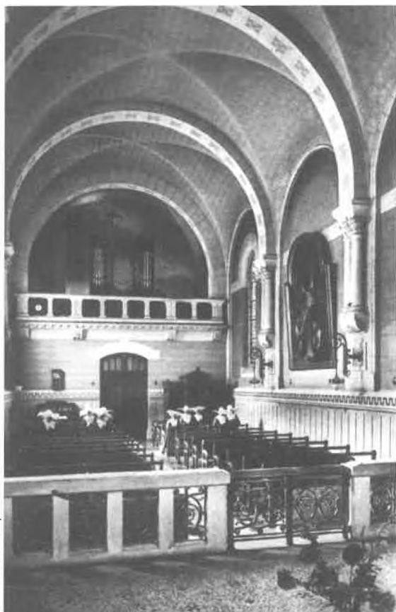
Coll. Michelle Guéritey

Deux claviers de 56 notes C-g ''' , (GO - REC), plaqués d'ivoire, dièses ébène.