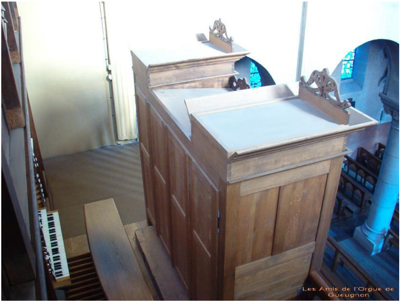
Les Amis de l'Orgue de Gueugnon