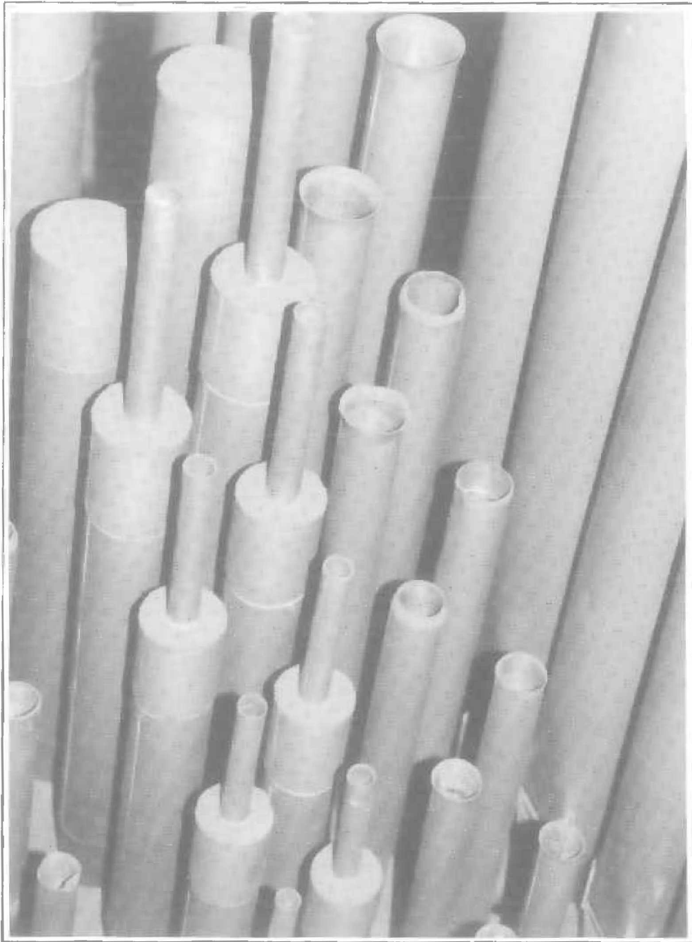
Fondation Eugène Napoléon - Détail de la tuyauterie du Grand-Orgue.