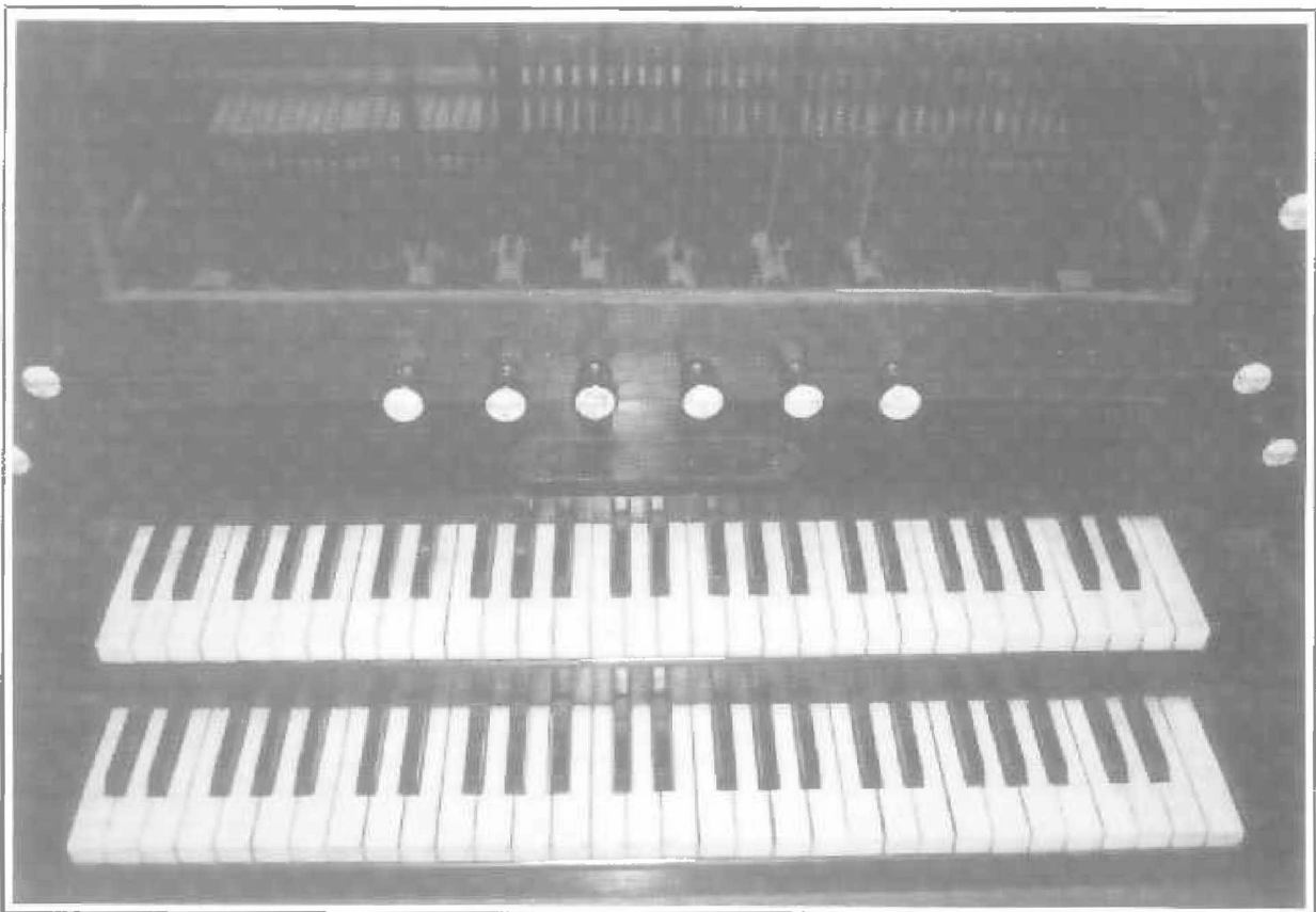
Fondation Eugène Napoléon - Détail de la console.