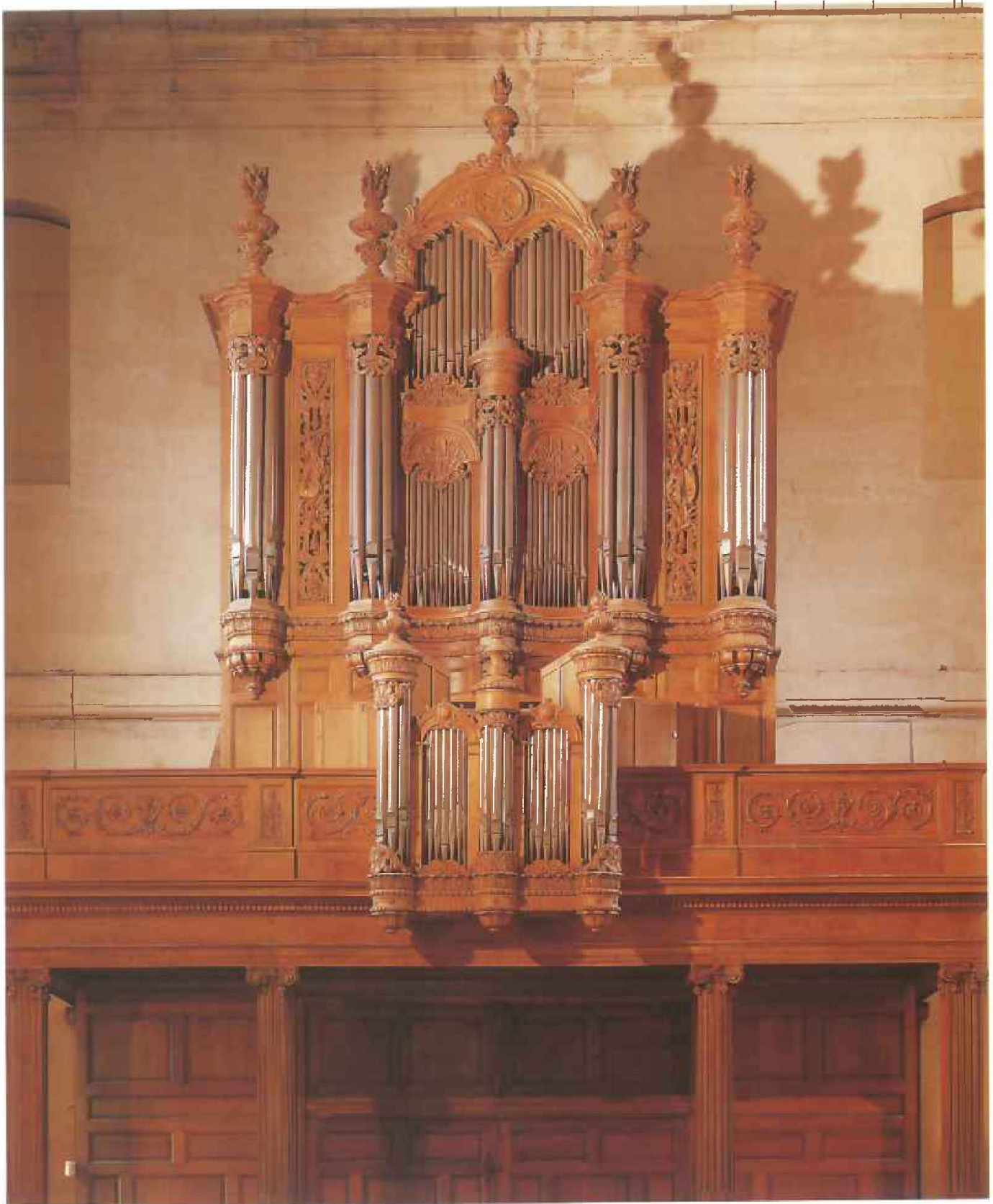
Église Saint-Louis de la Salpêtrière - Le grand orgue