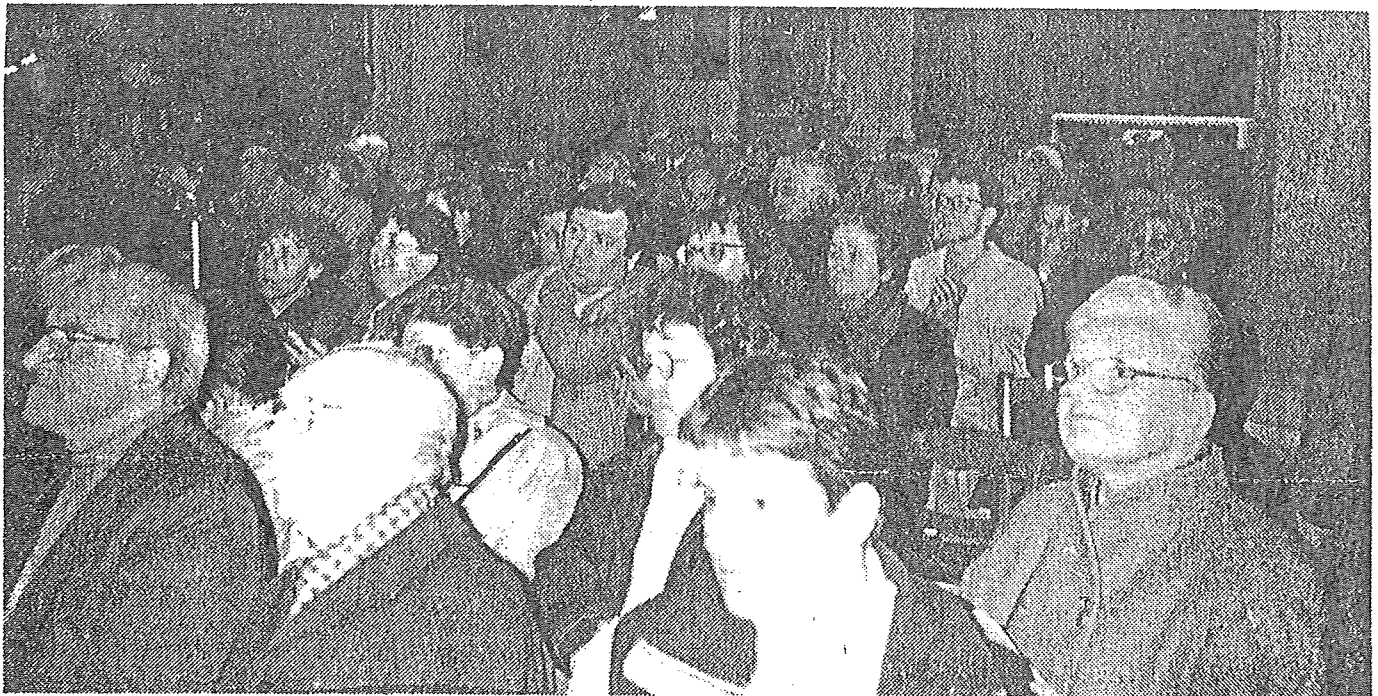
Une église bien remplie pour ce concert inaugural

Ce n'est pas seulement la gratuité - espérons-le - qui a fait remplir l'église Notre-Dame de Caudebec-lès-Elbeuf, dimanche après-midi.