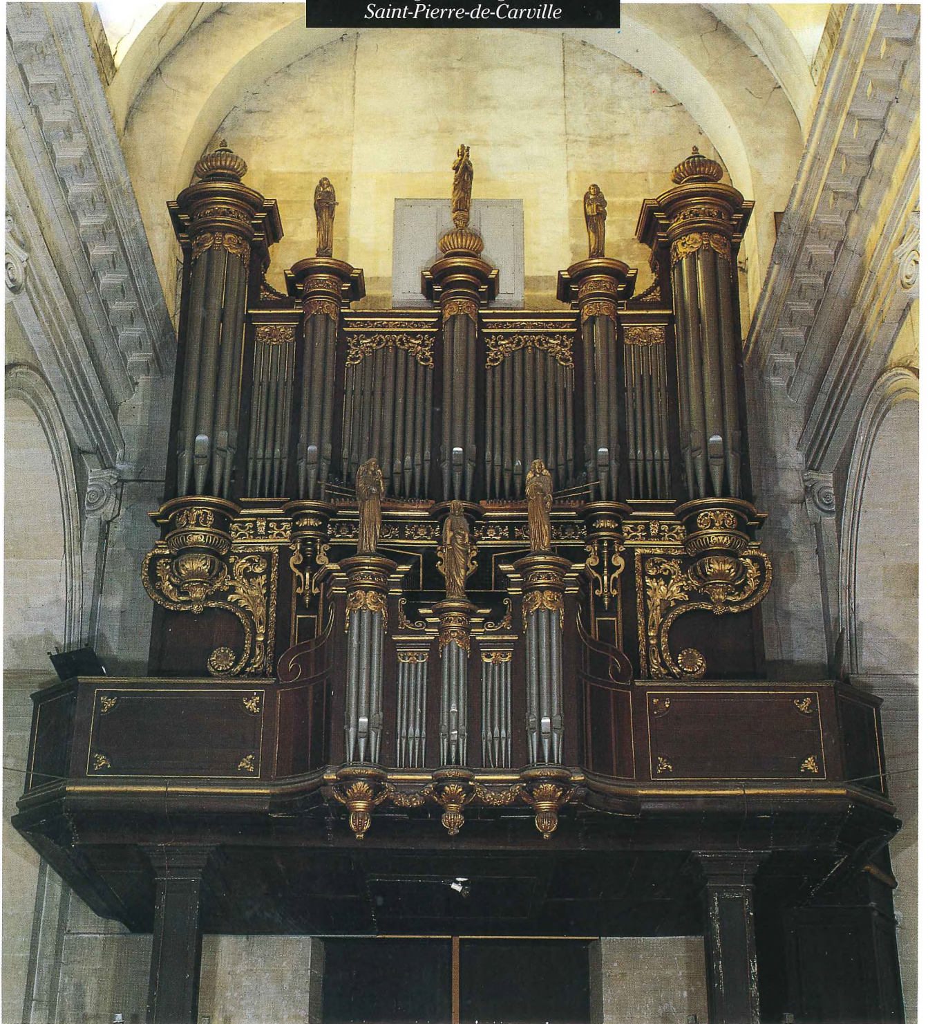
DARNETAL Orgue de l'église Saint-Pierre-de-Carville