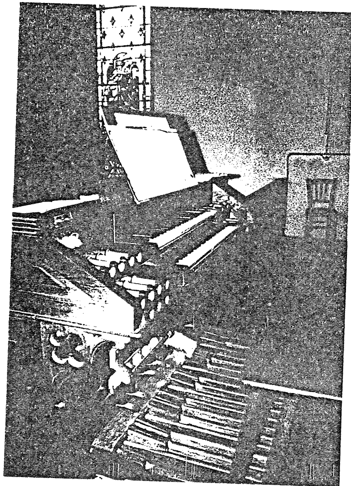
La console, séparée du buffet et tournée vers le chœur