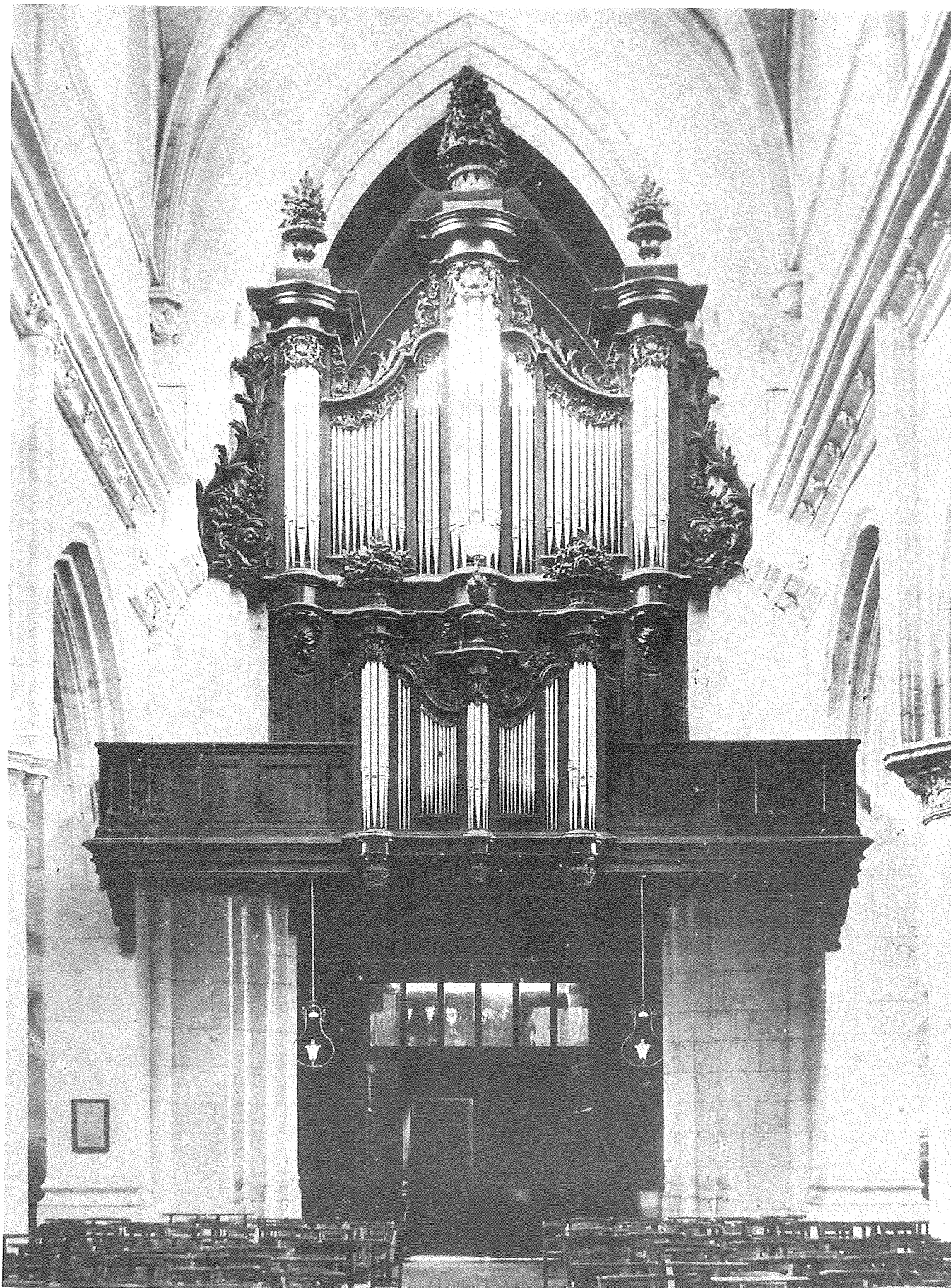
L'ancien buffet de l'abbaye de Beaubec en l'église Notre-Dame de Neufchâtel-en-Bray.