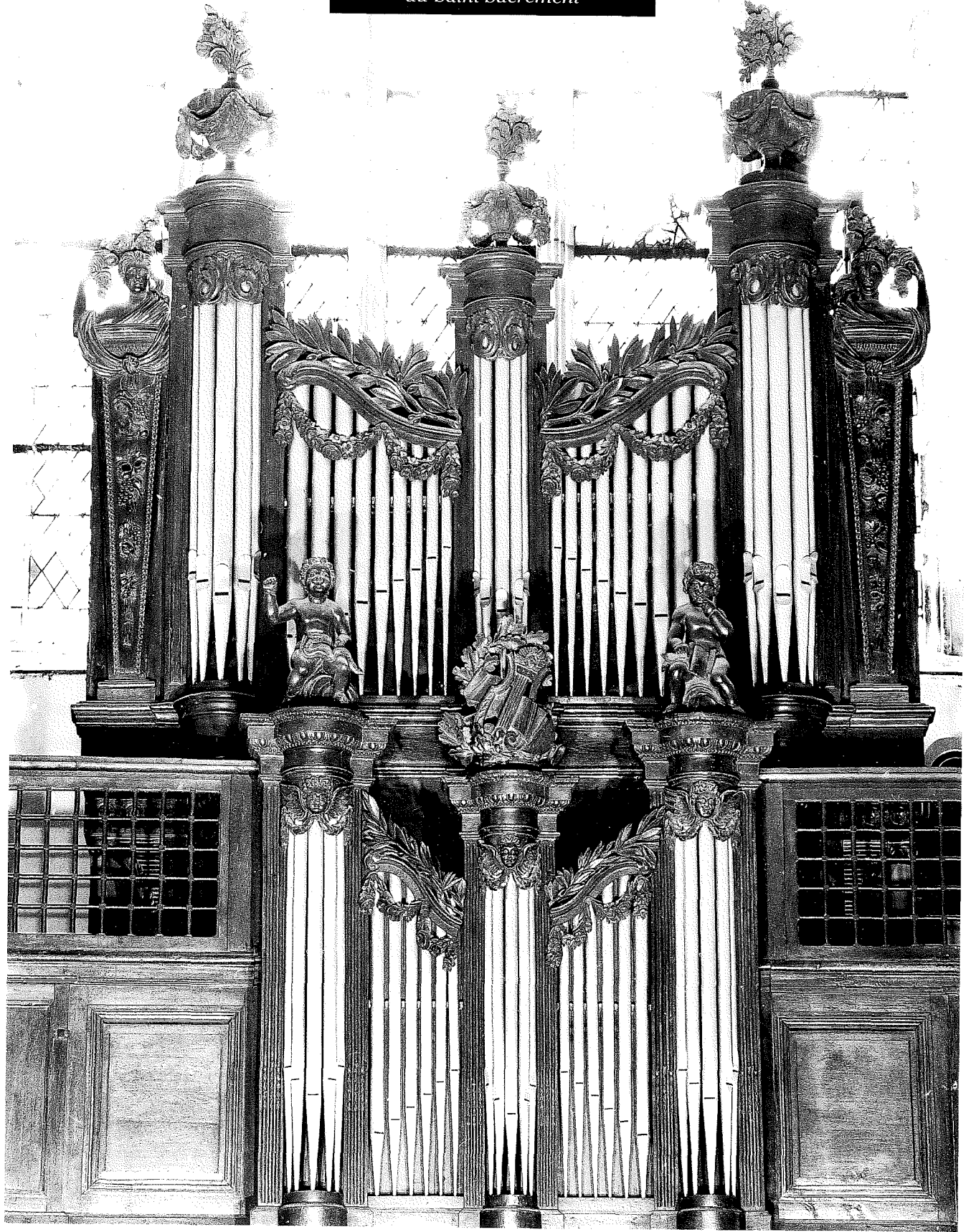
ROUEN Grand Orgue de la chapelle du Couvent des Bénédictines du Saint-Sacrement