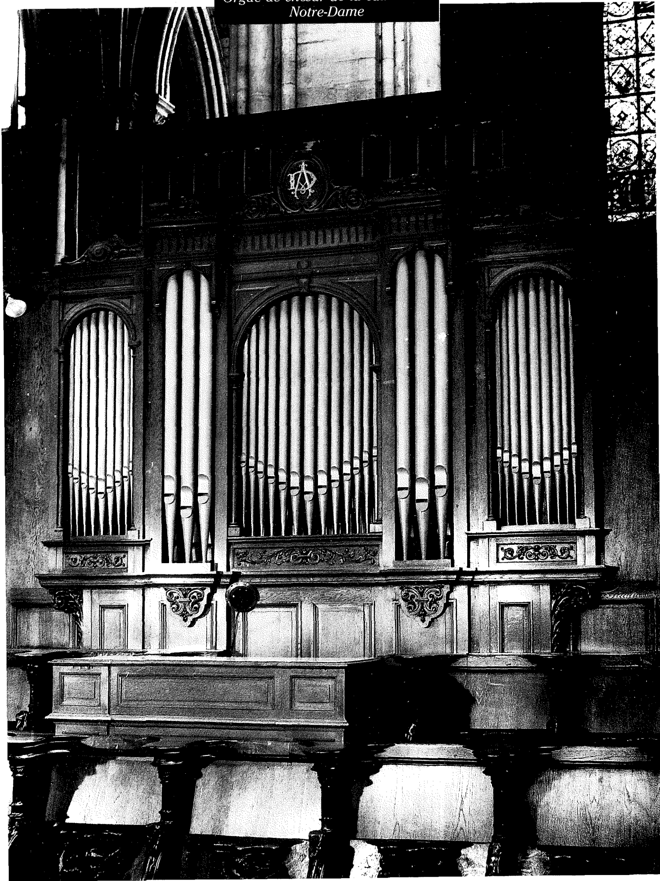
ROUEN Orgue de chœur de la cathédrale Notre-Dame