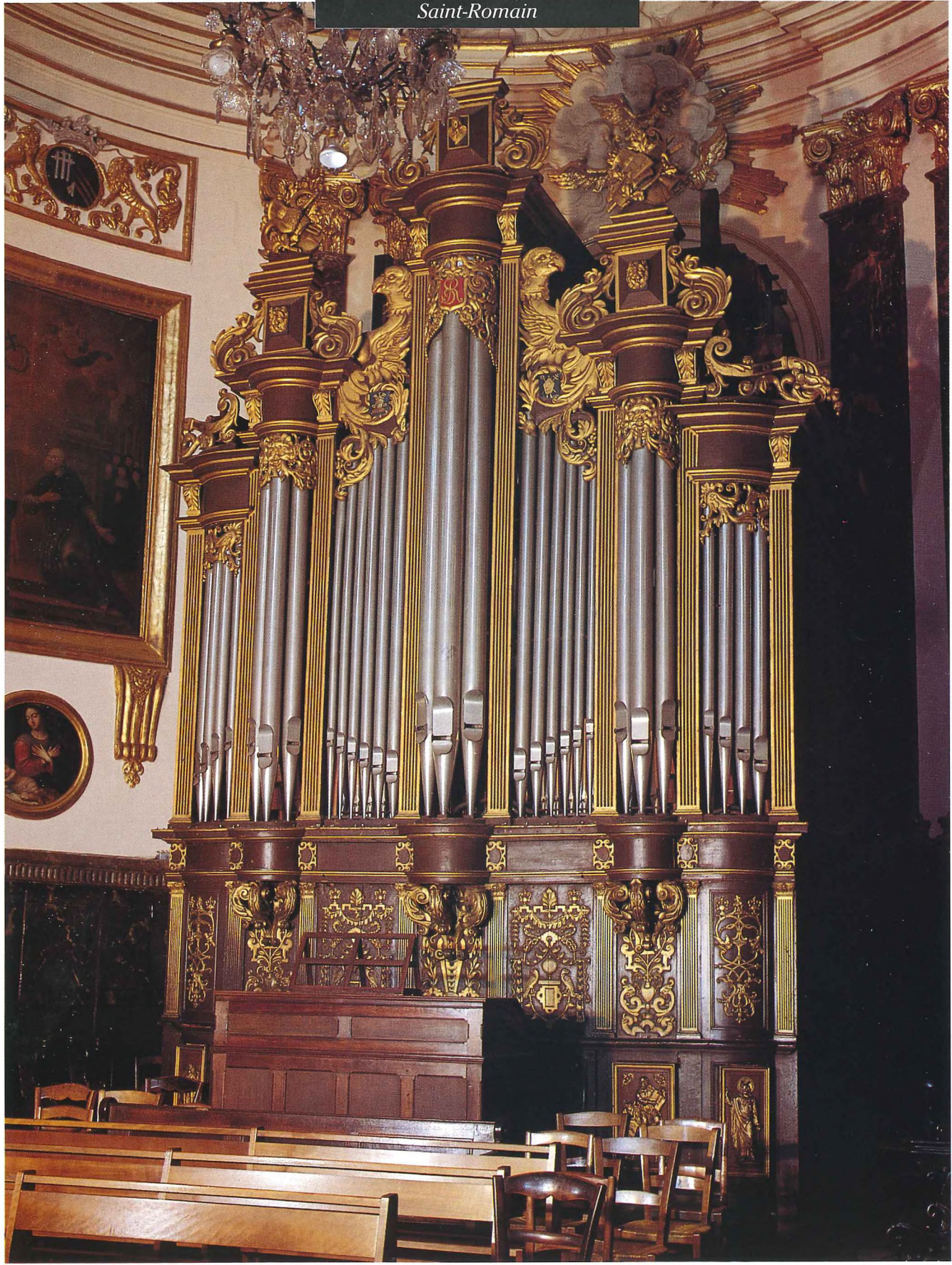
ROUEN Orgue de l'église Saint-Romain