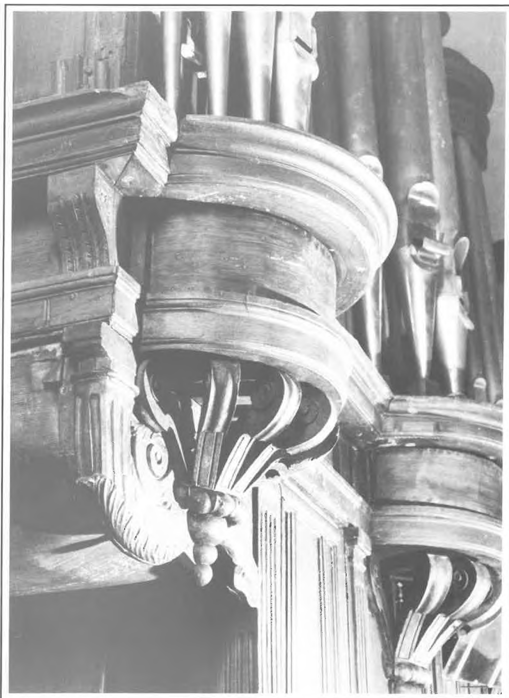
Bray-sur-Seine - Culot de la tourelle, côté UT, plaquée en 1645 sur le buffet plat de 1599