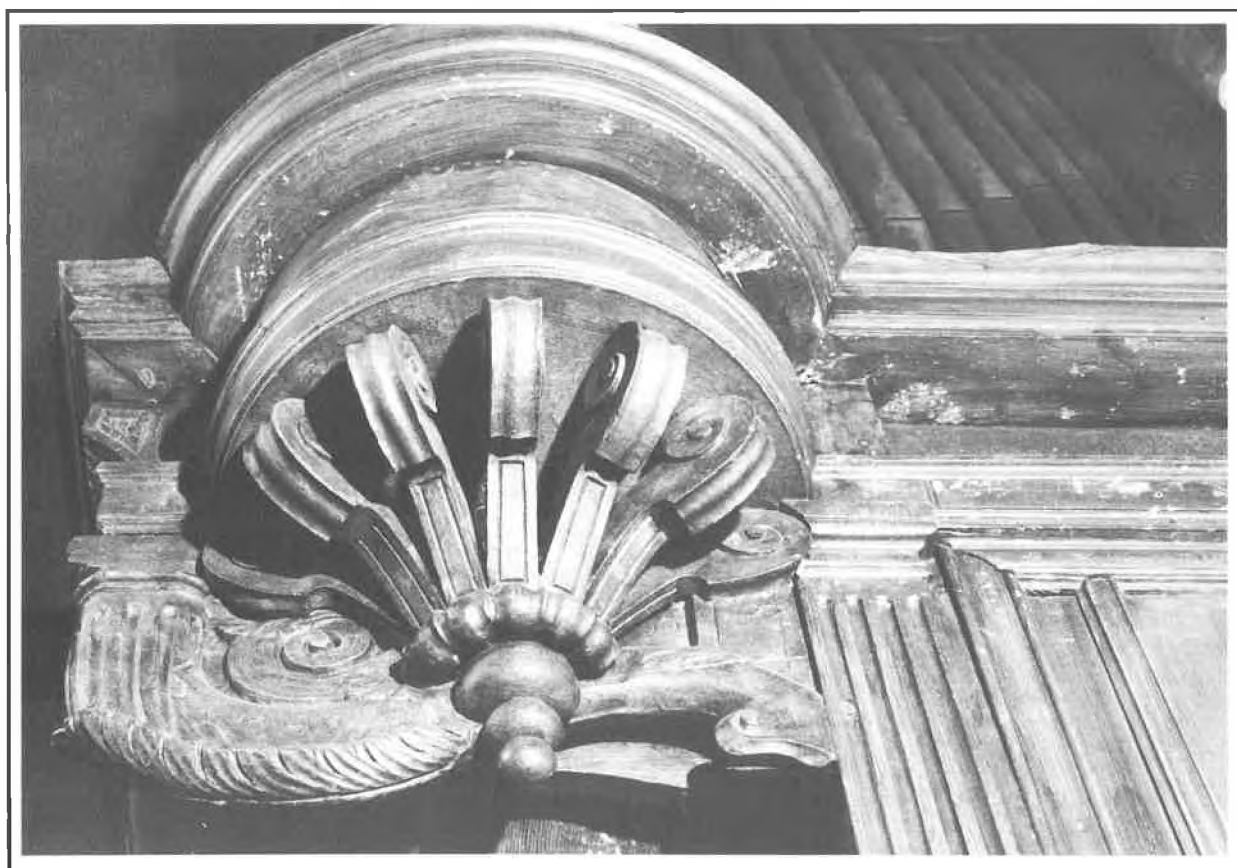
Bray-sur-Seine - Amortissement de la tourelle, côté UT, sous la console : date 15-99.