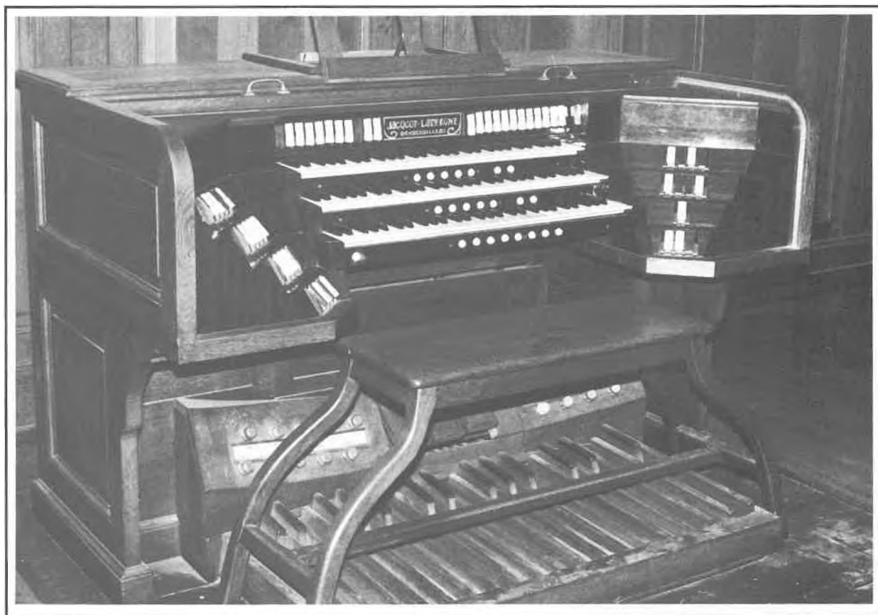
Fontainebleau - Salle du Jeu de Paume : la console de Jacquot-Lavergne