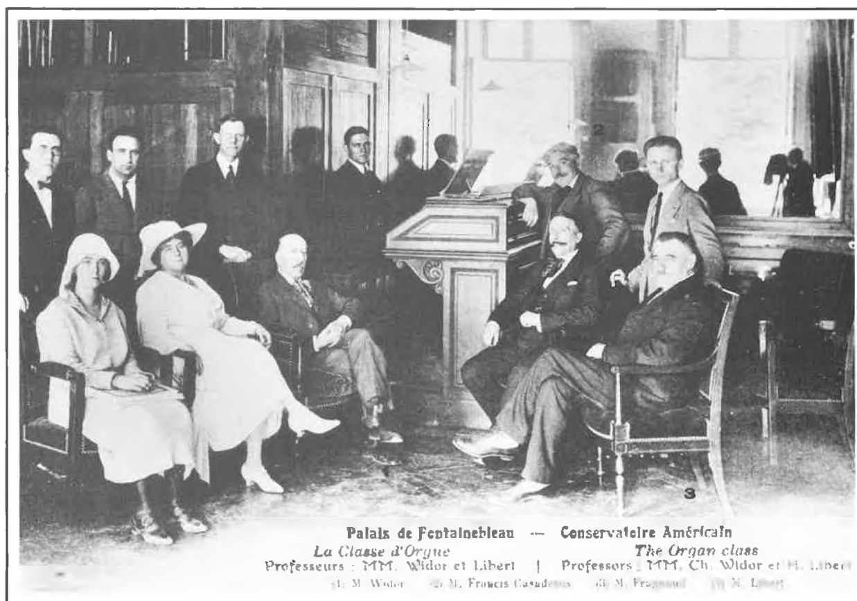
Fontainebleau - Salle du Jeu de Paume (carte postale ancienne)