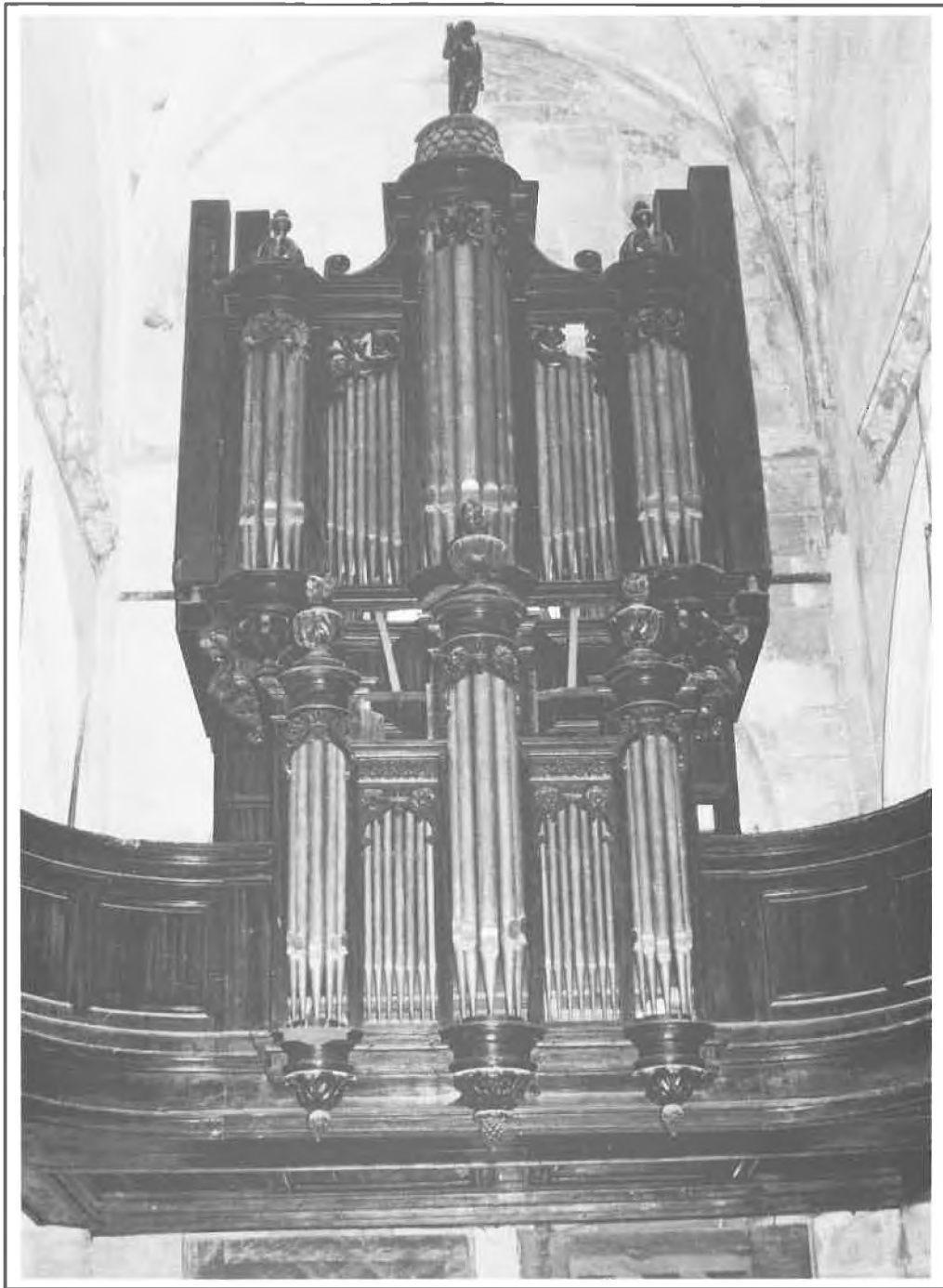
Le Mesnil-Amelot - Église Saint-Martin