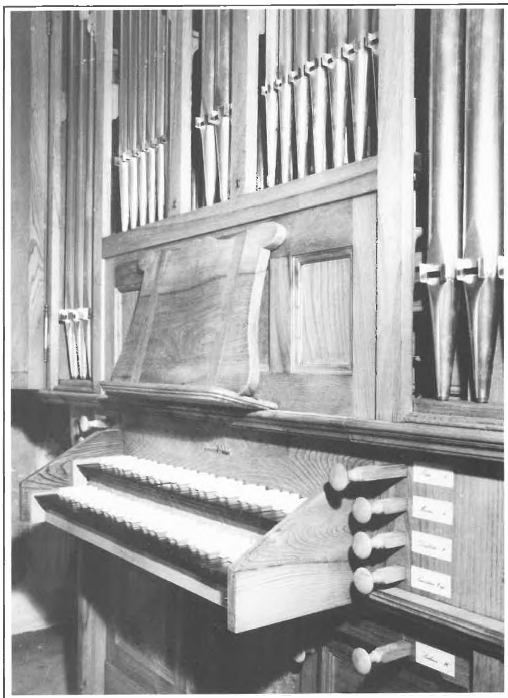
Saint-Pierre-lès-Nemours - Les claviers de l'orgue neuf (1989).