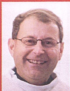
Le Père de Rubercy Curé du groupement paroissial de Marly-le-Roi

Les travaux engagés dans les trois premières étapes sont compatibles avec la réalisation de ce futur projet.