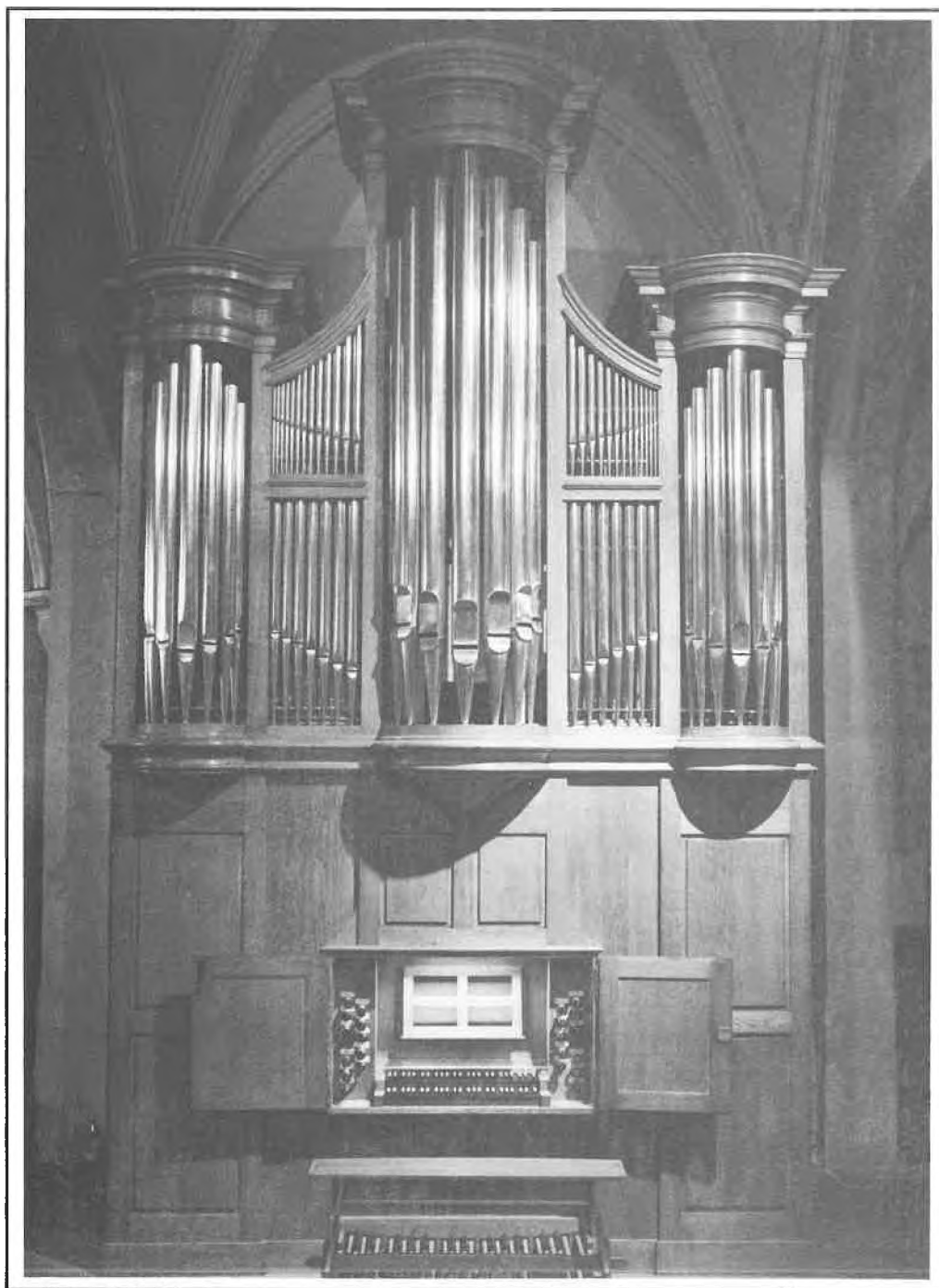
Orsay - Église Saint-Martin Saint-Laurent