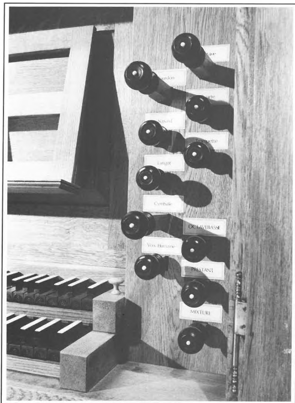
Orsay - Église Saint-Martin Saint-Laurent : les tirants de jeux