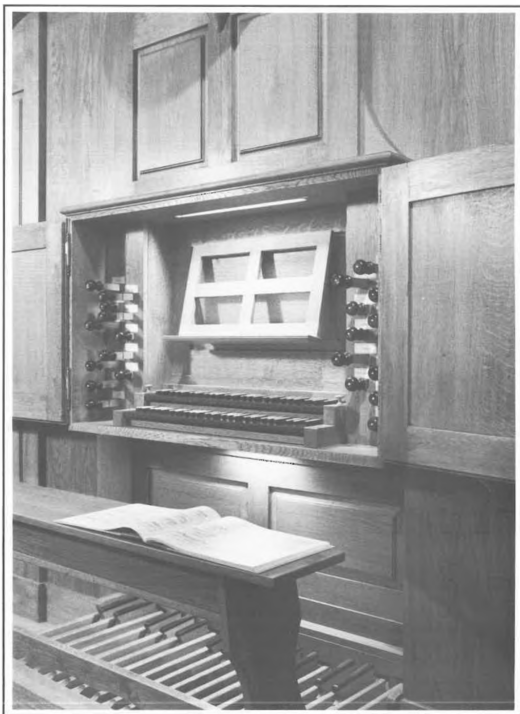
Orsay - Église Saint-Martin Saint-Laurent : la console