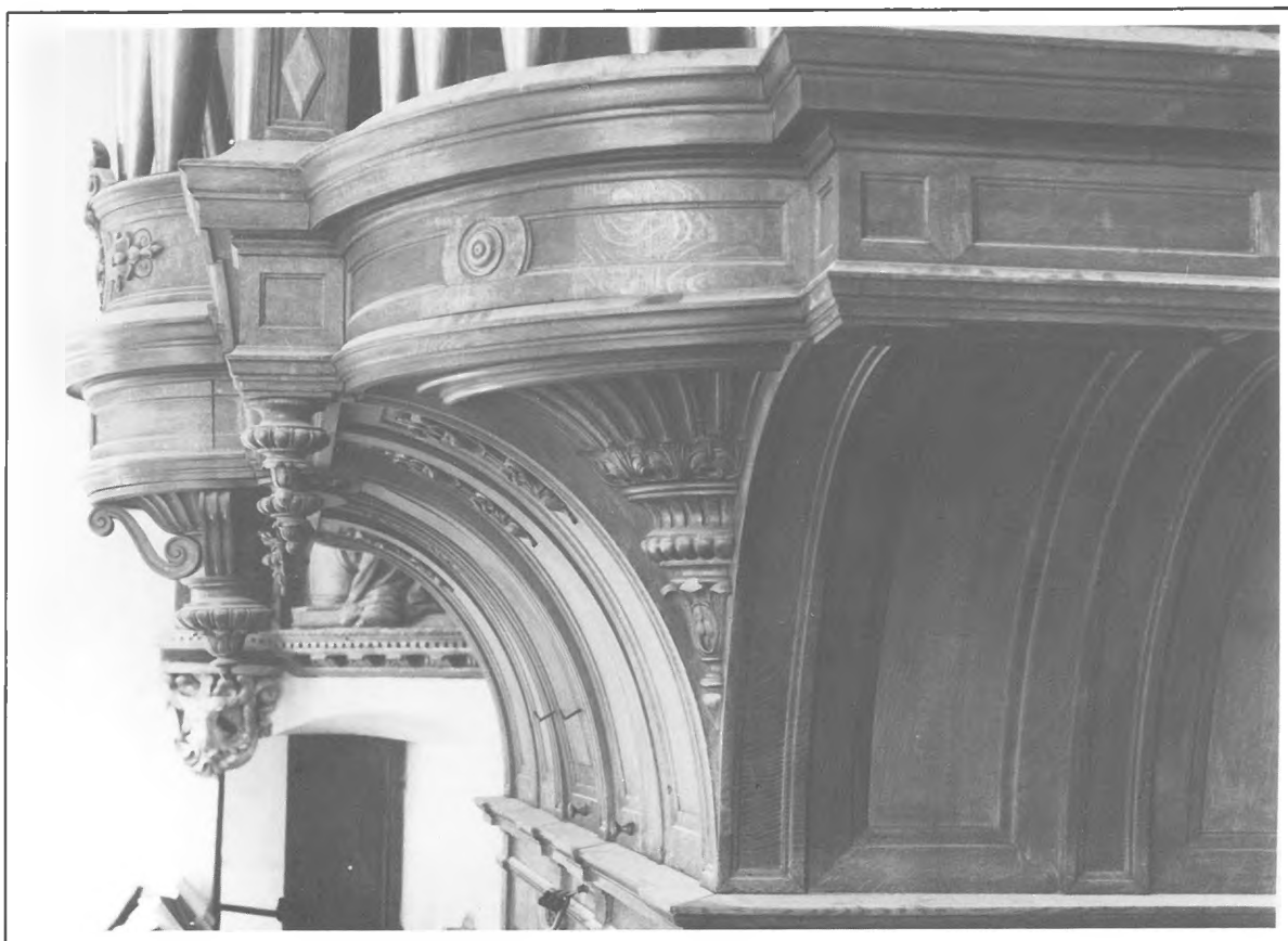
Château d'Écouen - Détails du buffet en chêne