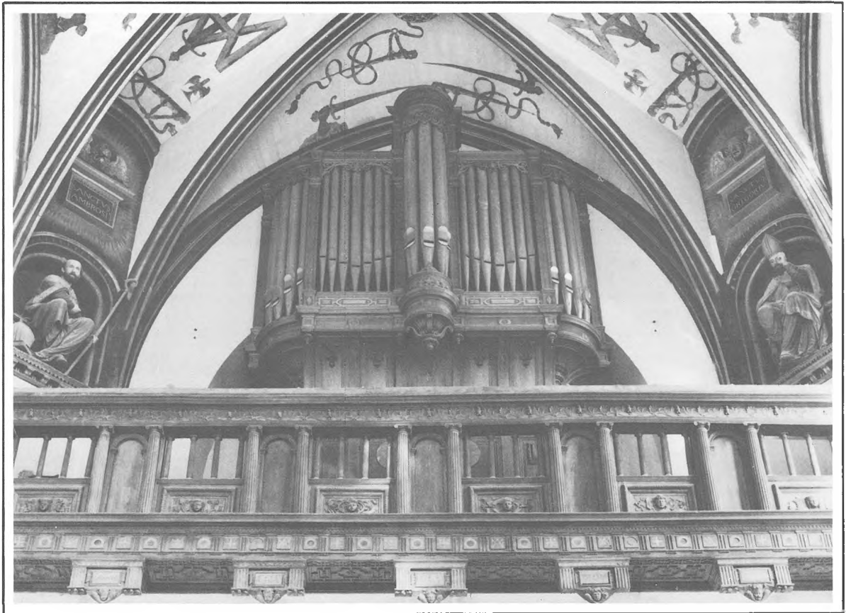
Château d'Écouen - Vue générale avec la tribune du XVI e siècle