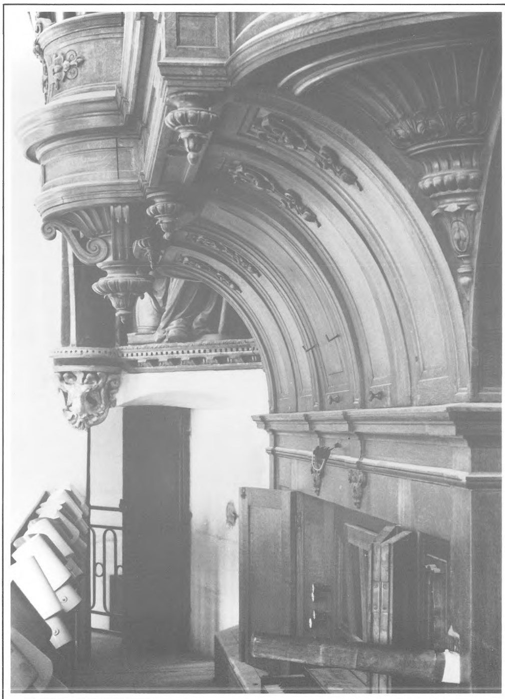
Château d'Ecouen - Détail de l'encorbellement de la Montre