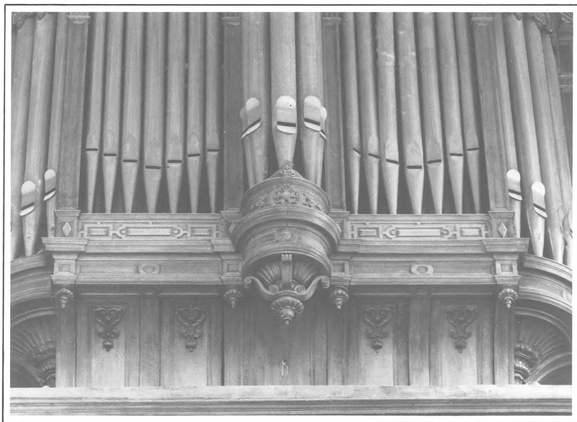
Château d'Ecouen - Les pieds de la Montre et le haut du soubassement